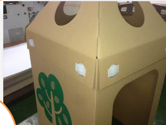
ジョイント付けて完成です。